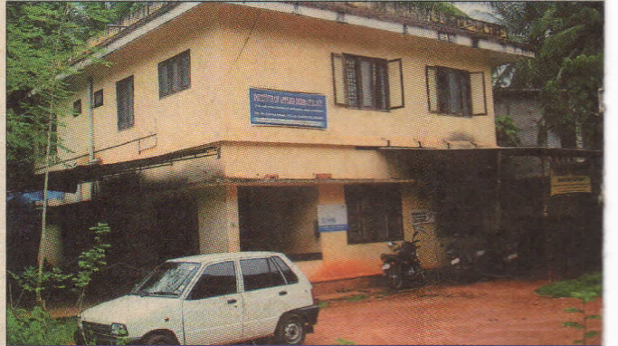
ಕಾಸರಗೋಡಿನ ಕೋಟಿ ಕಣಿಯಲ್ಲಿರುವ ಐವಡಿ ಸಂಸ್ಥೆಯ ಕಚೇರಿ

ದಾಖಲಾಗಬೇಕು. ಮೊದಲ ದಿನ ಕಾಲಿನ ಗಾತ್ರ, ತೂಕ ಮತ್ತು ಸುತ್ತಳತೆಯನ್ನು ಲೆಕ್ಕ ಹಾಕಲಾಗುತ್ತದೆ. ಮುಂದಿನ ದಿನಗಳಲ್ಲಿ ಆಯುರ್ವೇದ ಗಿಡಮೂಲಿಕೆಗಳಿಂದ ತಯಾರಿಸಲಾದ 'ಫಾಂಟಾ' ಚೂರ್ಣ ಬೆರೆಸಿದ ನೀರಿನಲ್ಲಿ ಕಾಲುಗಳನ್ನು ತೊಳೆಯಲಾಗುವುದು. ಕಂಪ್ರೆಷನ್ ಬ್ಯಾಂಡೇಜುಗಳನ್ನು ವಿಶಿಷ್ಟ ವಿಧಾನದಲ್ಲಿ ಸುತ್ತಿ ರೋಗಿಗಳಿಗೆ ವಿವಿಧ ಯೋಗಾಸನಗಳನ್ನು ತಿಳಿಸಿಕೊಡಲಾಗುವುದು.